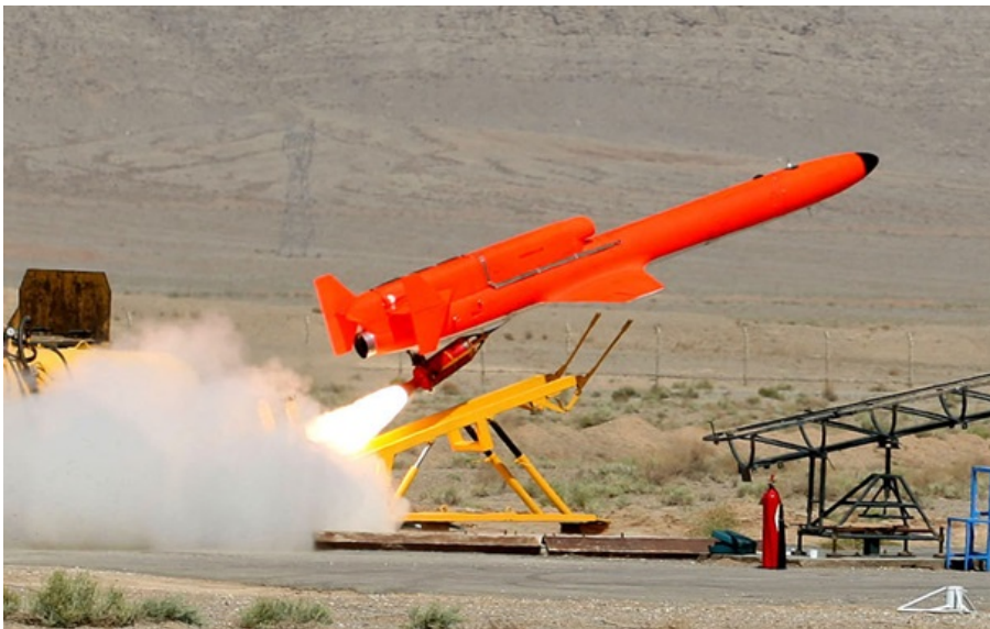
Іранський дрон Karrar

Реактивний безпілотною Герань-5 за своїми характеристиками ближчий до крилатої міні-ракети, ніж до звичайного дрону-камікадзе. Росіяни, традиційно, "списали" його з іранського Karrar.