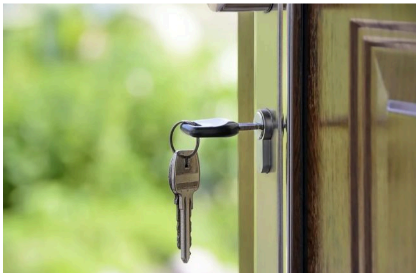
Фото: Оренда будинку

В Україні зросли ціни на довгострокову оренду приватних будинків, причому в окремих містах - майже вдвічі.