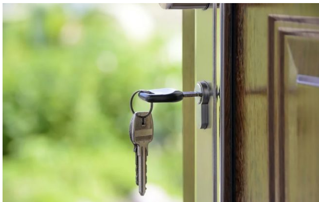
Фото: Оренда будинку

В Україні зросли ціни на довгострокову оренду приватних будинків, причому в окремих містах - майже вдвічі. Найбільше подорожчання зафіксували у Запоріжжі, тоді як найдорожчим містом залишається Київ.