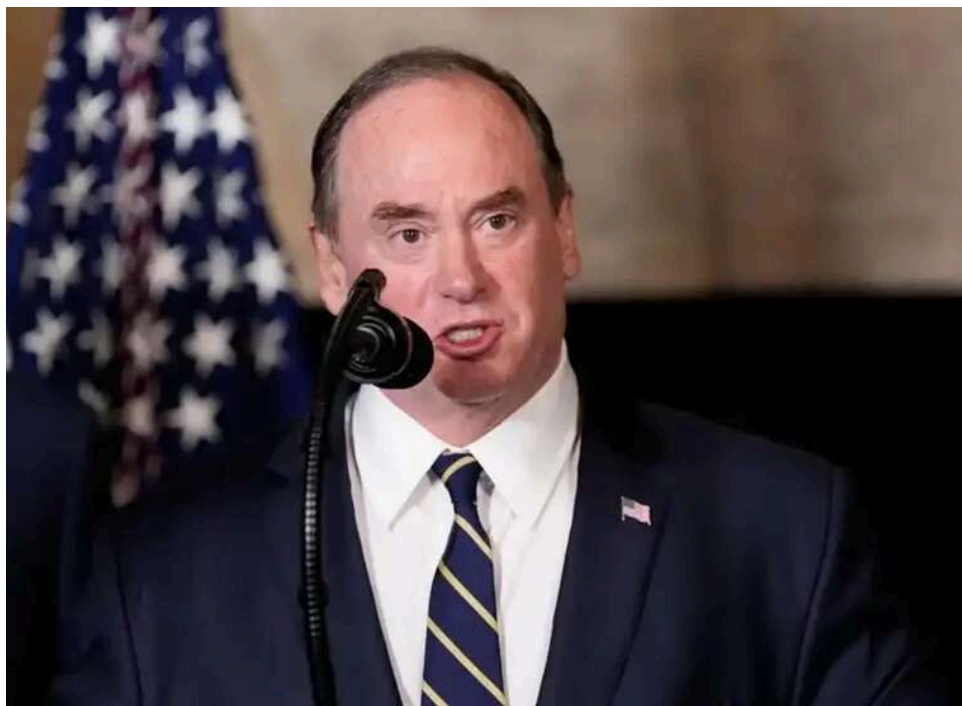
Очільник ВМС США Джон Фелан пішов у відставку через конфлікт із Пентагоном та прямі зв'язки з Трампом

Голова військово-морських сил (ВМС) США Джон Фелан пішов у відставку. Ймовірно, причиною того став конфлікт із Пентагоном через його зв'язки з президентом США Дональдом Трампом.