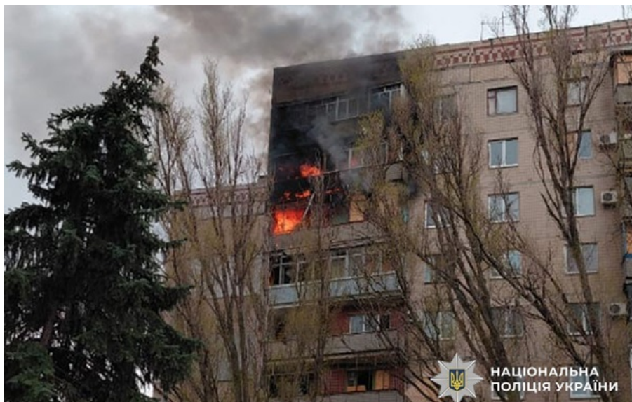
Наслідки російських атак

Загалом упродовж доби під вогнем перебували 12 населених пунктів. Руйнувань зазнав 21 цивільний об'єкт, з них дев'ять житлових будинків.