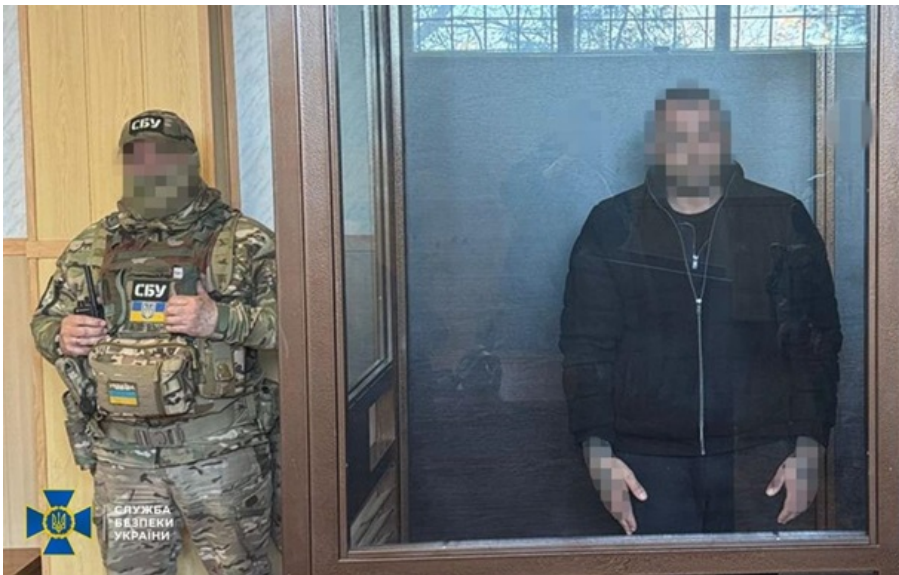
Кілеру загрожує до 12 років тюрми

Іноземний кілер у лютому під виглядом туриста прибув до Києва, а згодом поїхав до Одеси виконувати замовлення рашистів.