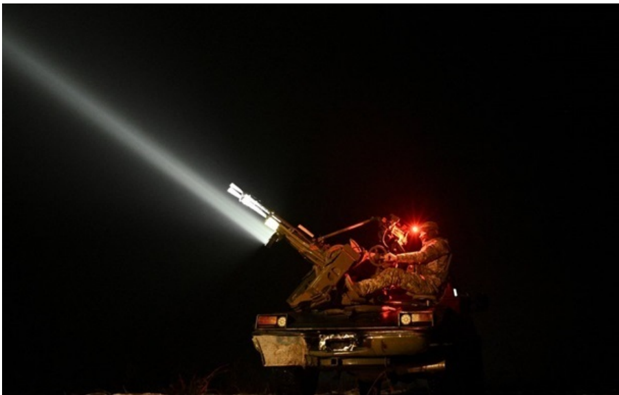
Днепр под атакой БПЛА

В одном из районов Днепра произошел пожар. По предварительным данным, никто не пострадал.