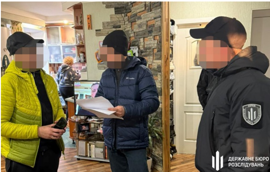
Фігуранти отримали підозри

Під час обшуків за місцями проживання та роботи фігурантів вилучили мобільні телефони, комп'ютерну техніку та матеріали справ.