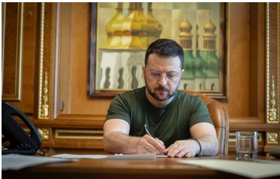
Володимир Зеленський увів санкції проти п'яти російських культурних пропагандистів

Участь Росії у Венеційській бієнале – це не про культуру, а про використання міжнародних майданчиків для легітимізації агресії та поширення пропаганди, зазначили в ОП.