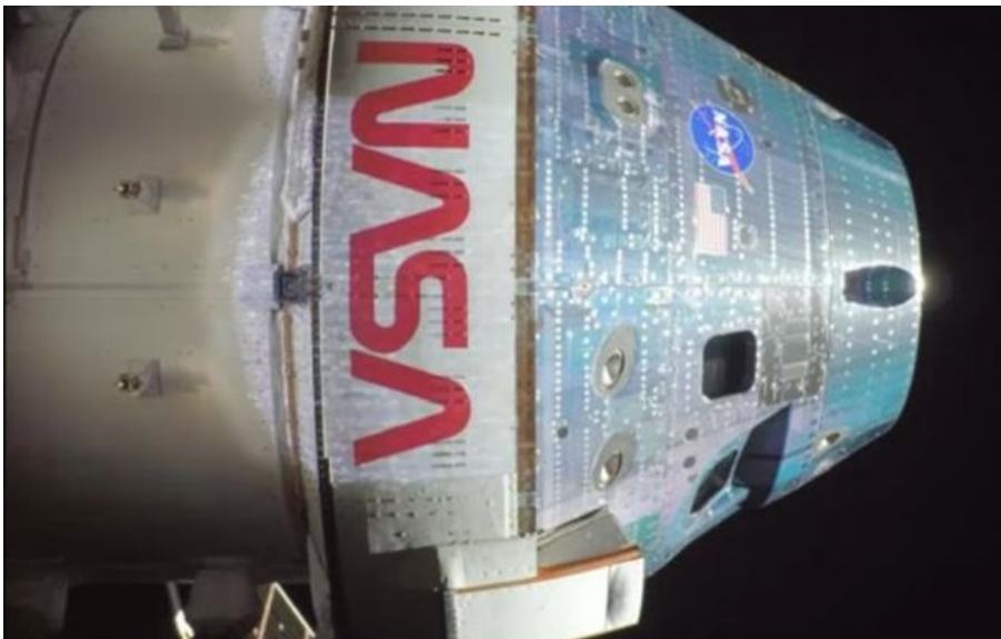
Artemis II

Місія вже пододала понад пів мільйона миль і стала однією з найрезонансних із часів висадка на Місяць 1969. Втім, навіть досвідчені члени екіпажу визнають: саме фінальна фаза може стати найнебезпечнішою.