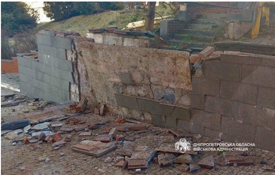
Последствия российской атаки в Днепре

Оккупанты ночью более 10 раз атаковали три района Днепропетровской области беспилотниками.