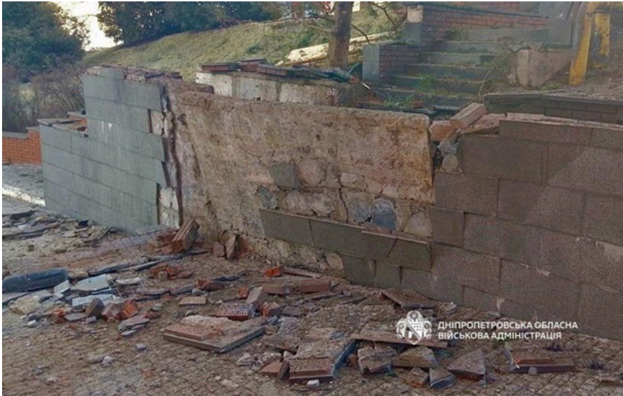
Последствия российской атаки в Днепре

Оккупанты ночью более 10 раз атаковали три района Днепропетровской области беспилотниками.