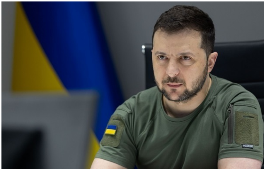
Президент України Володимир Зеленський

У Росії перестав працювати Telegram. За даними міжнародного дослідницького проекту OONI, рівень збоїв під час заходу до месенджера наблизився до 100%.