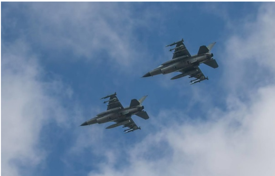
Українська авіація вдарила по важливим цілям росіян

Було завдано ударів по пусковій установці системи С-300В та її багатоканальній станції наведення ракет, а також по пункт управління російських БПЛА.