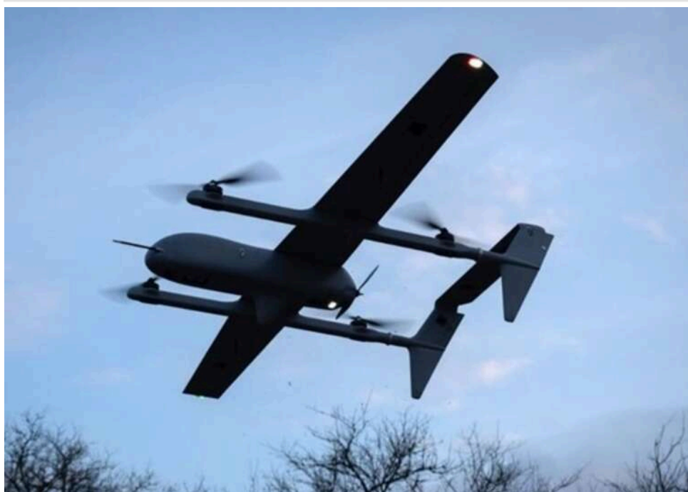
Українські БпЛА атакували низку регіонів РФ: вибухи біля Москви та в Тверській області