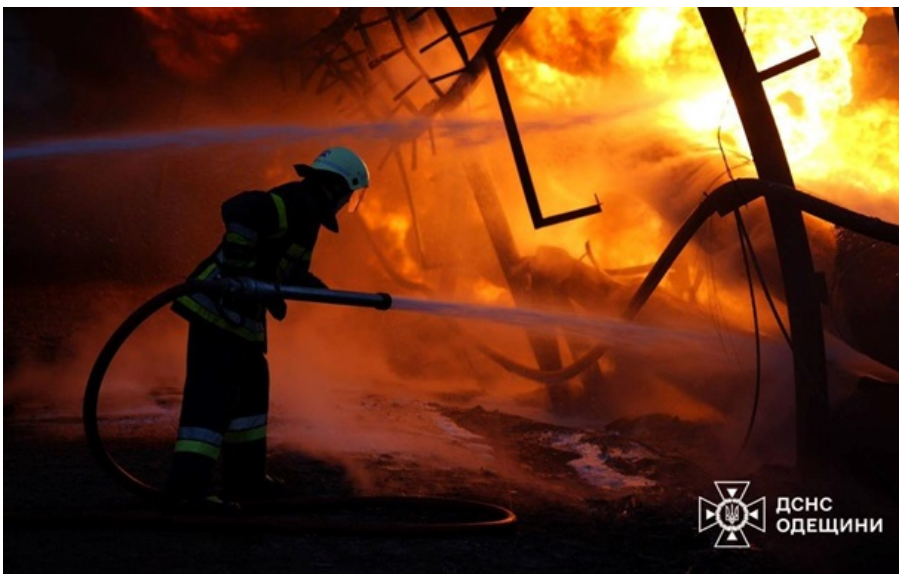
Ліквідація наслідків російської атаки в Одеській області

Також "шахеда" атакували енергетичну інфраструктуру, спричинивши пошкодження об'єктів та порушення в електропостачанні.