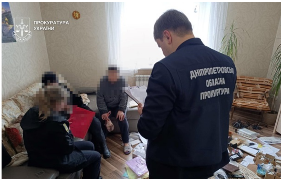
В течение 2019-2024 годов в ДБСТ воспитывали троих мальчиков и столько же девочек

О жестоком обращении стало известно только после того, как старший мальчик поступил в учебное заведение и решился рассказать о пережитом.