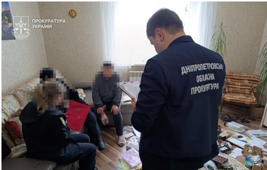
В течение 2019-2024 годов в ДБСТ воспитывали троих мальчиков и столько же девочек

О жестоком обращении стало известно только после того, как старший мальчик поступил в учебное заведение и решил рассказать о пережитом.