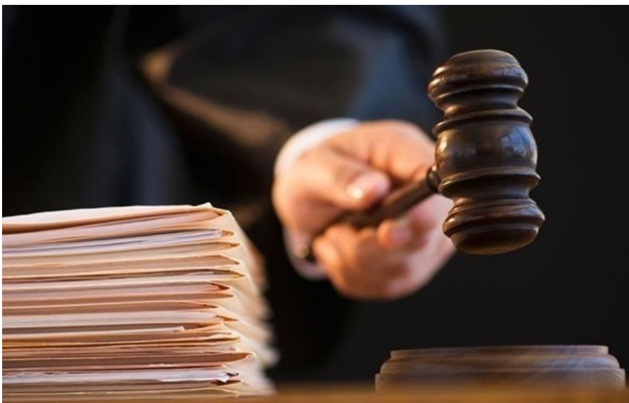
(ілюстративне фото)

На Вінниччині чоловік отримав довічне за систематичне зґвалтування дитини