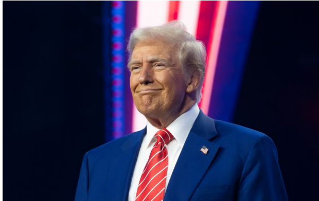
Фото: Дональд Трамп

Сенат США вже вп'яте за цей рік провалив голосування за резолюцію, яка могла б обмежити військові повноваження президента Дональда Трампа проти Ірану.