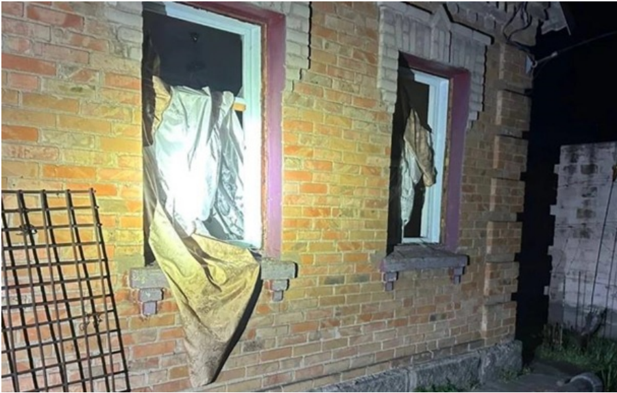
Росіяни вдарили по Дніпропетровщині

У Синельниківському районі двоє людей загинули і один поранений. Ще двоє людей - 74-річний і 40-річний чоловіки - постраждали у Нікопольському районі.