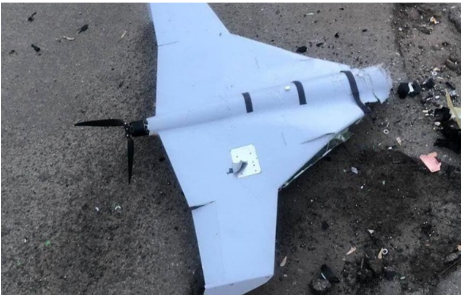
Сили ППО знешкодили 113 зі 128 російських дронів