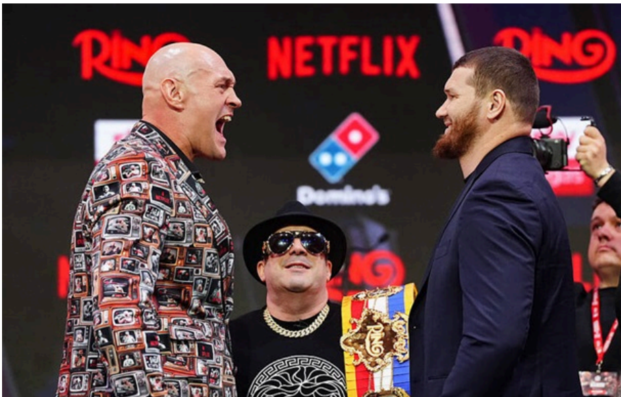
Тайсон Ф'юрі та Арсланбек Махмудов

Тайсон Ф'юрі та Арсланбек Махмудов провели фінальну битву поглядів перед своїм поєдинком, який відбудеться вже завтра.