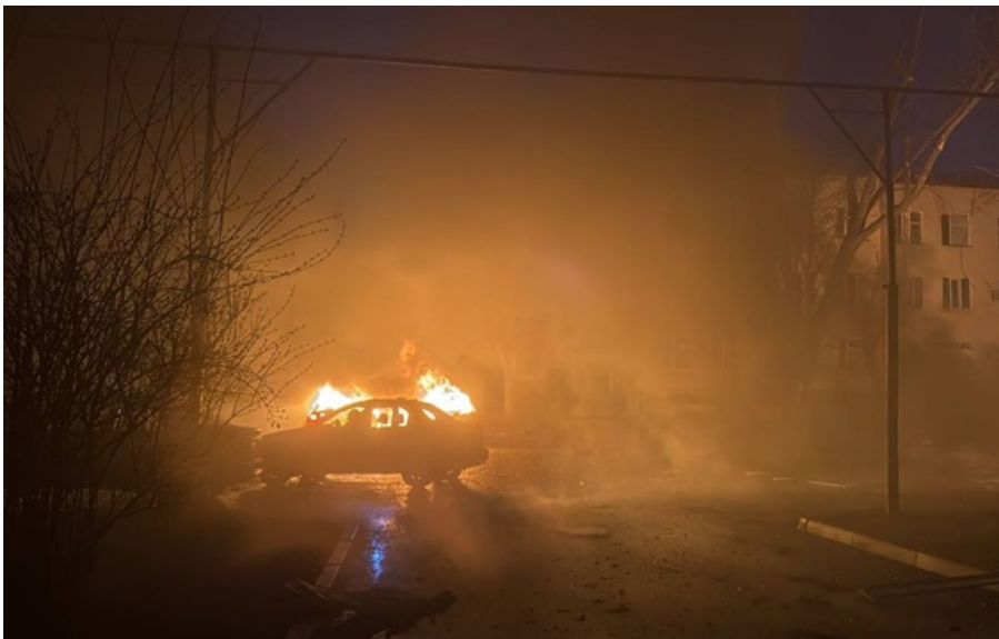
Центр Конотопа після атаки РФ

Із пошкодженого житла ведеться евакуація людей, перебито газові мережі в одному з центральних кварталів міста.