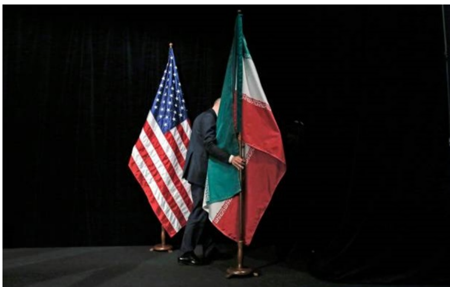
У рамках врегулювання конфлікту між США та Іраном Китай у першу чергу опікується власною економічною безпекою

Пекін планує тиснути на Вашингтон щодо скасування санкцій проти китайських компаній, які ведуть бізнес з Іраном, представляючи свою допомогу в укладенні миру як "послугу", за яку Трамп має розрахуватися.