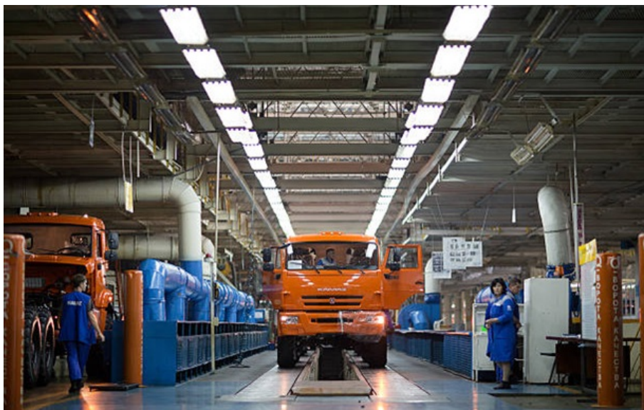
Найбільші автовиробники Росії фіксують поглиблення кризи

Високі відсоткові ставки стримують попит, китайські виробники витісняють російські компанії з ринку, а державне замовлення, яке підтримувало галузь, поступово вичерпується.