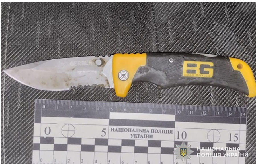
Житель Днепра ранил представителя ТЦК

Во время общения 58-летний местный житель неожиданно достал нож и ударил им в бедро 24-летнего военнослужащего ТЦК и СП.