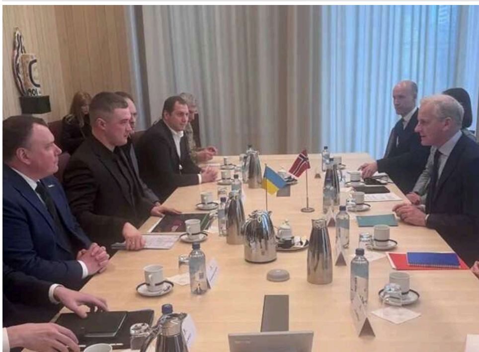
Норвегія виділить 302 мільйони доларів на закупівлю американської зброї для України

Уряд Норвегії оголосив про виділення 302 млн доларів на закупівлю озброєнь у США для подальшої передачі Україні. Рішення ухвалено в рамках міжнародної військової підтримки Києва.