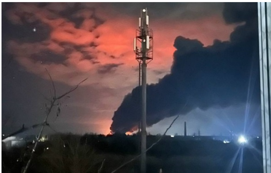
У містах Росії вибухи і пожежі

У тимчасово окупованих Перевальську Луганської області, Маріуполі Донецької області та Мелітополі на Запоріжжі також гучно, повідомляють соцмережі.