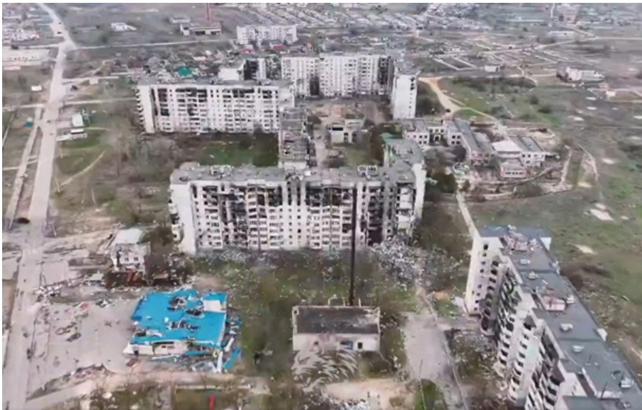
Кадри зі зруйнованого російськими окупантами міста Олешки

Російські окупанти перетворили місто Олешки в Херсонській області на привид. Реальність, яку ніхто не перепише, зазначили автори відео.