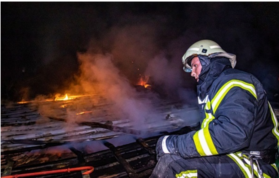
Спасатель на месте атаки РФ

Взрывная волна повредила многоэтажный дом и помещение банка, двое человек получили ранения.