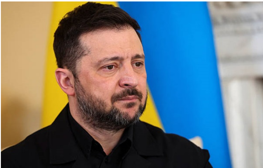
Президент України Володимир Зеленський

Людям необхідний Великдень без воєнних загроз, а для Росії цей період є шансом продемонструвати реальне прагнення до миру, зауважив український лідер.