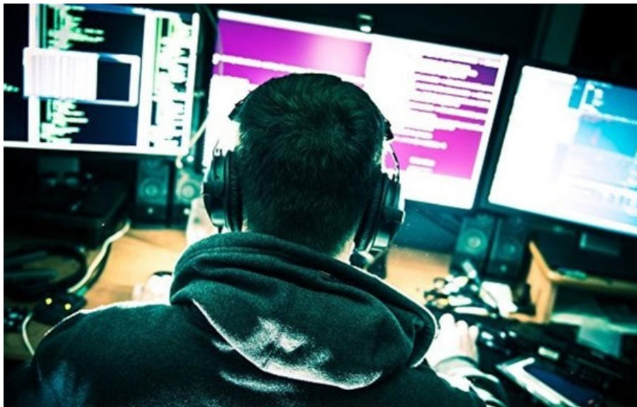
(ілюстративне фото)

Школяр створив власну програму, що обходила оплату