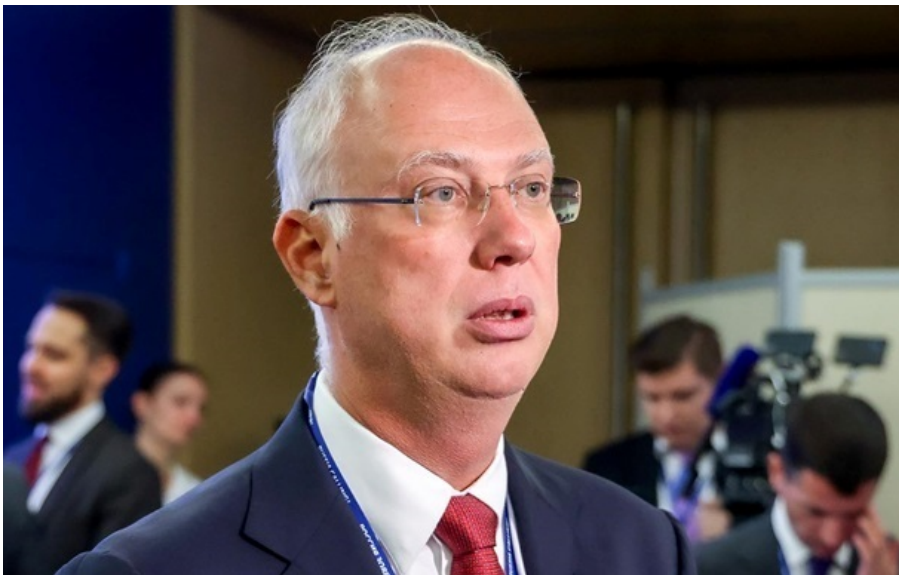
(ілюстративне фото) Спеціальний посланець Володимира Путіна Кирило Дмитрієв

Візит відбувається напередодні рішення Штатів про продовження пом'якшення санкцій на російську нафту.