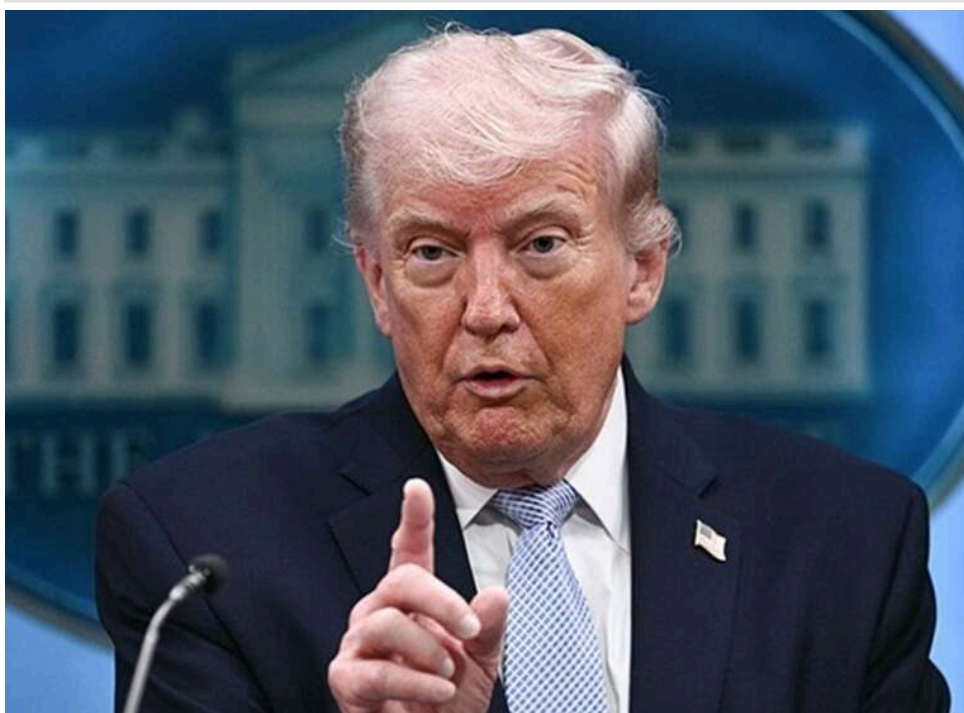
Дональд Трамп встановив ультиматум щодо перемир'я та переговорів з Іраном, - ЗМІ

Президент США Дональд Трамп надав ворожим іранським фракціям короткий термін для об'єднання навколо контрпропозиції. Інакше продовжене ним перемир'я завершиться.