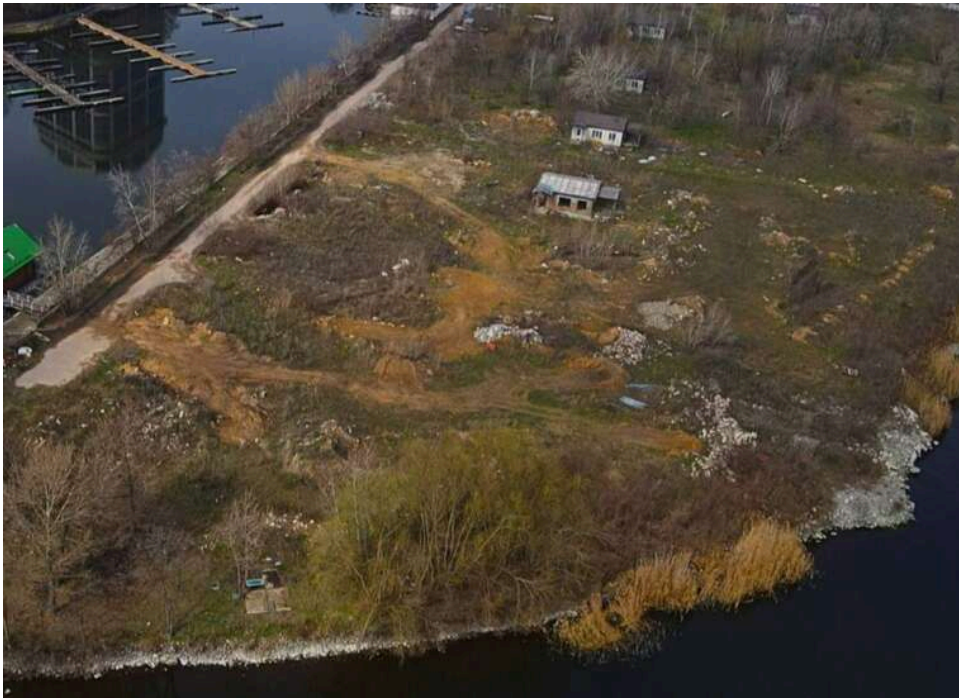
Озеленення під «нафтовим дощем»: прокурори Туапсе висадили алею на тлі палаючого НПЗ

Пожежа на нафтопереробному заводі в Туапсе, нафтовий дощ і чорний дим не завадили співробітникам міжрайонної прокуратури висадити дерева.