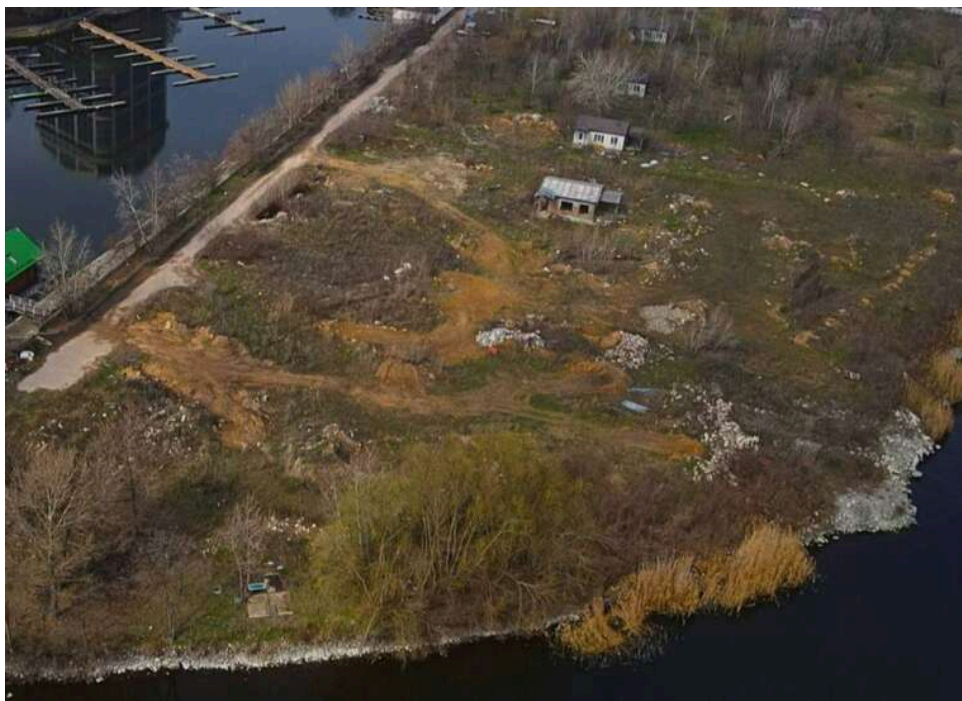
Озеленення під «нафтовим дощем»: прокурори Туапсе висадили алею на тлі палаючого НПЗ

Пожежа на нафтопереробному заводі в Туапсе, нафтовий дощ і чорний дим не завадили співробітникам міжрайонної прокуратури висадити дерева.