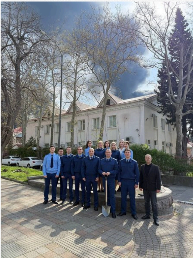
Колектив сфотографувався на тлі установи, за якою видно дим

Також там зазначили, що "ця добра ініціатива стала не тільки внеском у доброустрій курортного міста, а й символічним жестом пам'яті про подвиг радянського народу у роки Великої Вітчизняної війни", а працівники прокуратури "отримали змогу внести особистий внесок у збереження історичного вигляду Туапсе і висловити повагу до пам'яті захисників Вітчизни"