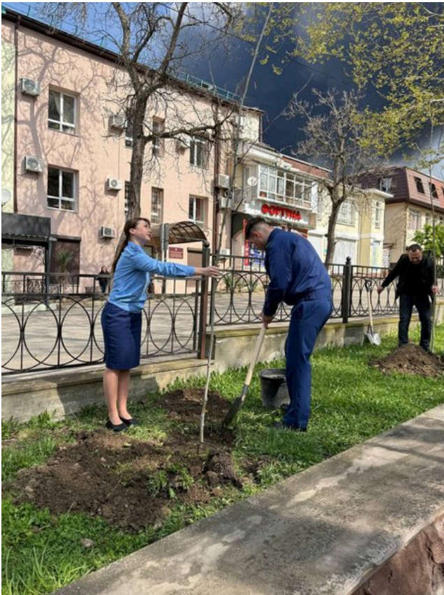
Співробітники прокуратури висаджують дерева до 9 травня