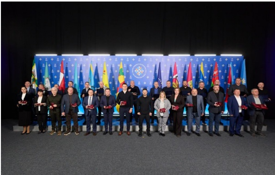
Зеленський також відзначив нагородами представників органів місцевого самоврядування та військових адміністрацій

Відзнака була вручена багатьом містам в Донецькій, Харківській, Сумській, Дніпропетровській і Хмельницькій областях.