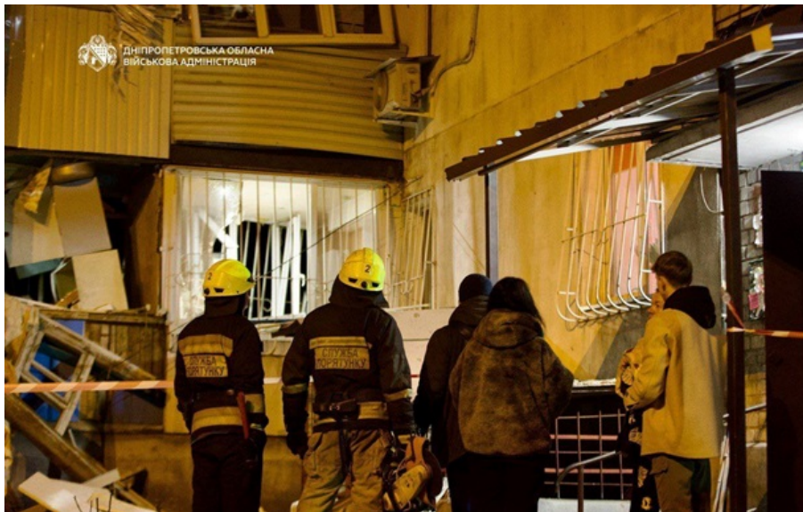
Последствия атаки на Днепр

Взрывная волна разбила несколько сотен окон в домах. Число пострадавших продолжает расти.