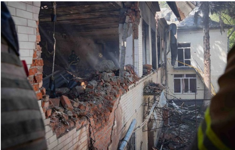
Російські "шахеда" влучили у дитсадок в Сумах

Угорщина повернула Україні викрадені кошти і золото Ощадбанку, а Росія зірвала режим припинення вогню. Кореспондент.net виділяє головні події вчорашнього дня.