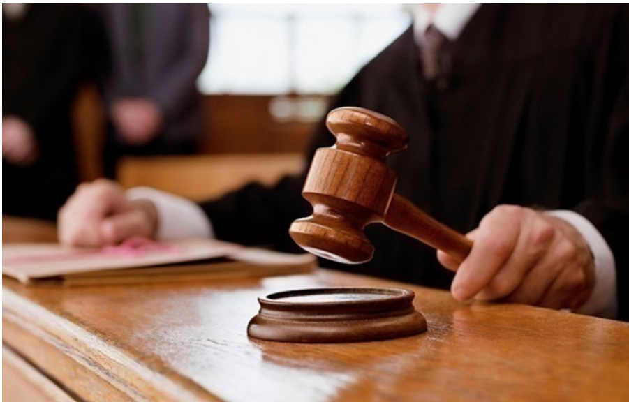
Фото: thekiewtimes.ua (ілюстративне фото) Буковинець змушував дітей створювати порно

Потерпілі дівчатка віком 8-10 років із Чернівецької, Київської, Львівської та Хмельницької областей.