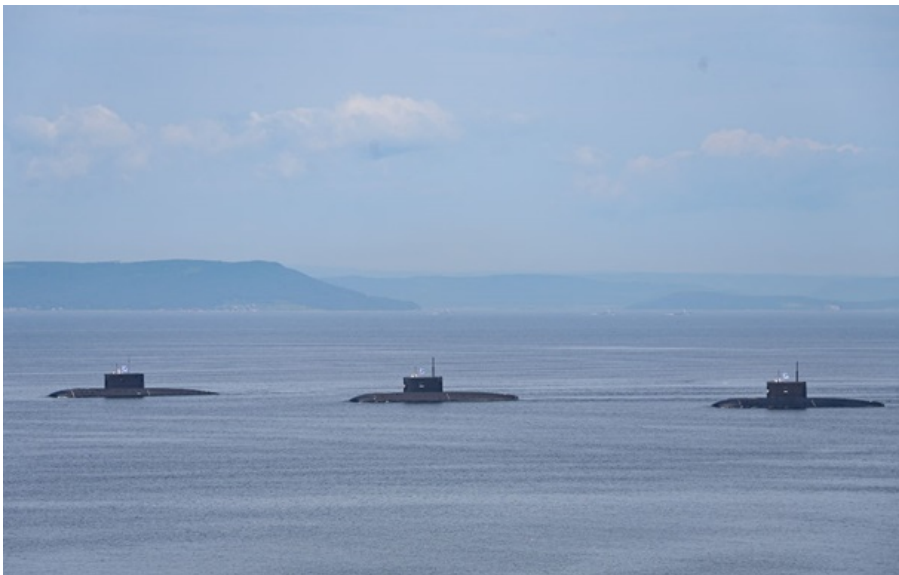
Підводні човни РФ

Лондон заявив, що зірвав операцію Москви у Північній Атлантиці і пригрозив Москві "серйозними наслідками".