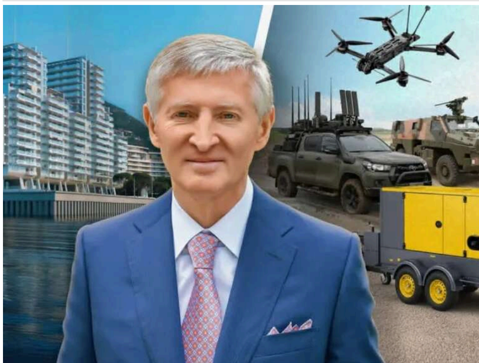
Квартира в Монако чи 1,5 тисячі Inguar-3: як елітні активи Ахметова могли б змінити ситуацію на фронті

$550 млн, або близько 24,3 млрд грн за курсом НБУ – сума, яку журналісти зіставили з витратами на елітну нерухомість Ахметова.