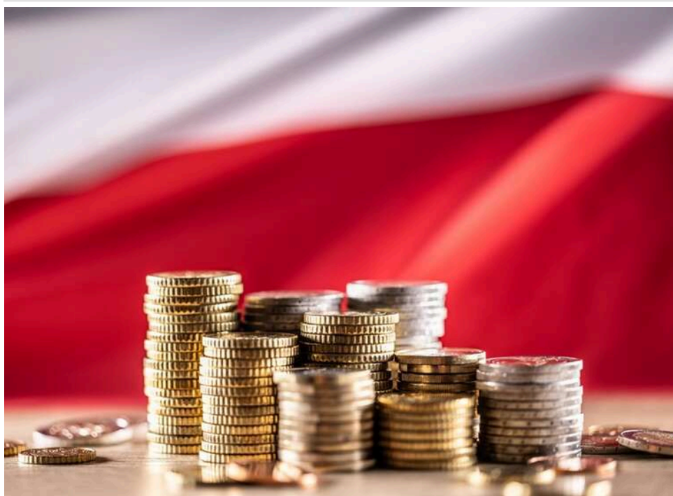
Будівельна криза в Польщі: країна стала лідером ЄС за темпами обвалу виробництва

У Польщі різко погіршилася ситуація в будівельній галузі. За даними Євростату, у лютому 2026 року обсяги виробництва в секторі скоротилися на 13,7% порівняно з аналогічним періодом минулого року. Це найгірший показник серед усіх країн Євросоюзу.