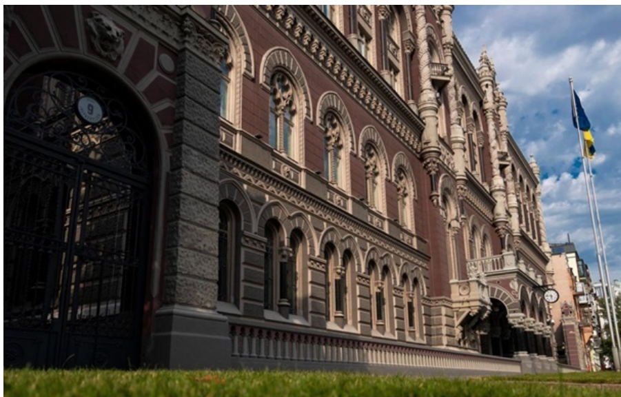
Нацбанк вирішив знизити курс гривні на 10 квітня

На міжбанку американська валюта додала в ціні 7 копійок і тепер перебуває на рівні 43,47-44,52 грн/долар купівля-продаж.