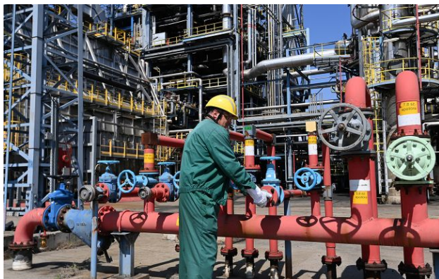
Робітник на угорському НПЗ, що переробляє нафту з "Дружби"

Історія із зупинкою нафтопроводу "Дружба" закінчилася - Угорщина отримає довгоочікувану російську нафту, а Україна - гроші від Євросоюзу.