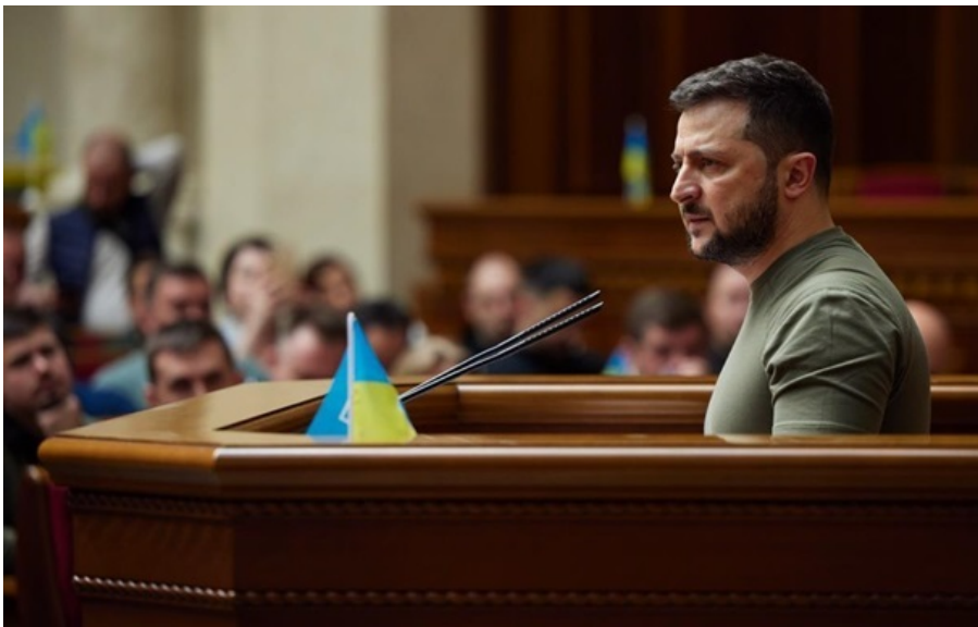
Минулого тижня Володимир Зеленський закликав нардепів проголосувати за важливі закони

Глава держави закликав представників регіональних влад, уряду та Верховної Ради продовжити тісну співпрацю.