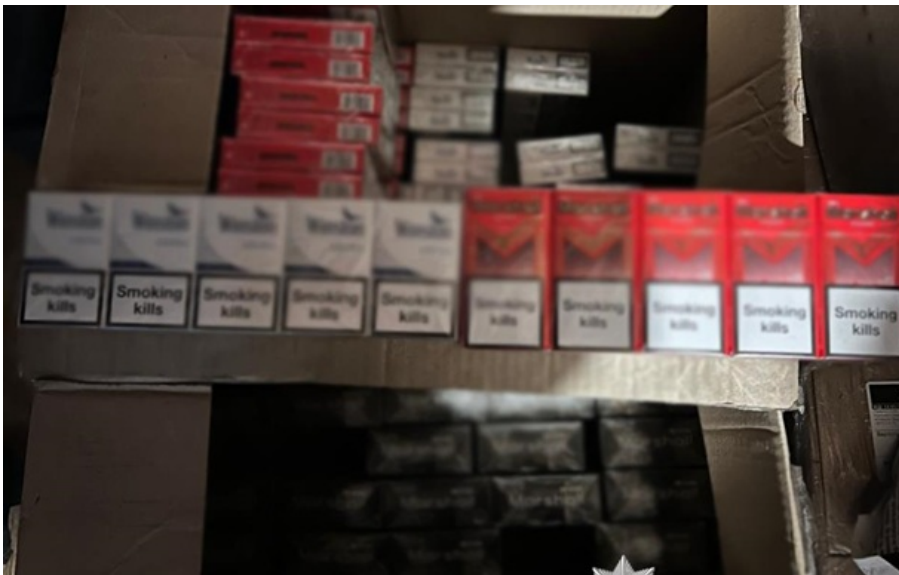
Правоохоронці вилучили тонни тютюну та десятки тисяч цигарок у підпільних виробників

Серед вилученого зокрема понад 5 000 пачок цигарок, а також більше ніж 1,2 млн гільз для цигарок.