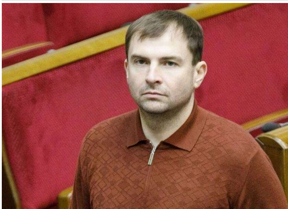
Народний депутат Федір Христенко втратив мандат після набрання чинності вироку суду

Народний депутат Федір Христенко втратив мандат після набрання чинності вироку Печерського районного суду Києва.