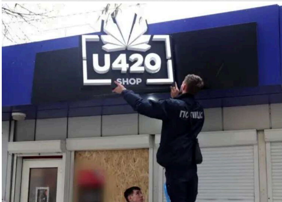
Мексиканський тупик: Нацполіція не може домогтися екстрадиції лідера «Хімпрому», попри запити

Правоохоронці стикаються з тривалими процедурами та затримками у взаємодії з мексиканськими колегами. Деталі процедури і можливі перешкоди відкривають нові питання у розслідуванні.